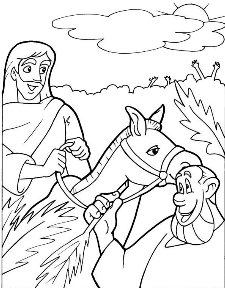
s povolením autora pre Bulletin. V prípade záujmu o pravidelný odber píšete na: bulletin.nedele@gmail.com