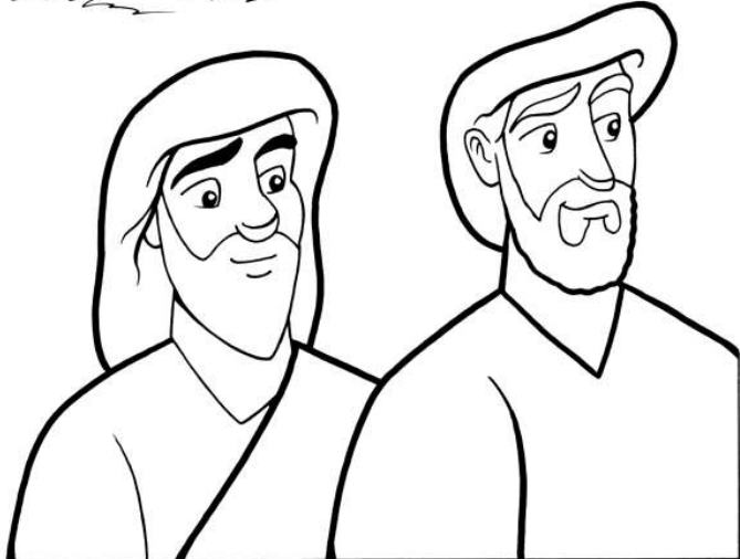
s povolením autora pre Bulletin. V prípade záujmu o pravidelný odber píšete na: bulletin.nedele@gmail.com