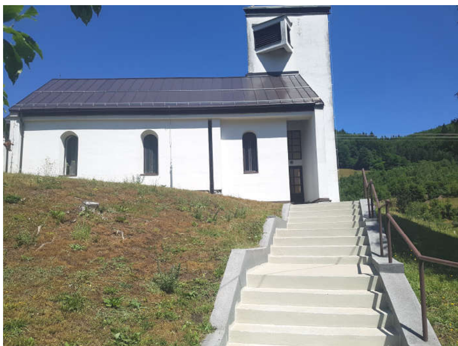
Júl 2023 - po svojpomocnom vymaľovaní všetkých obvodových stien kostola a rekonštrukcii prístupového schodiska