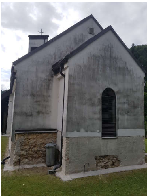
Jún 2023 plesen a riasy na stenách