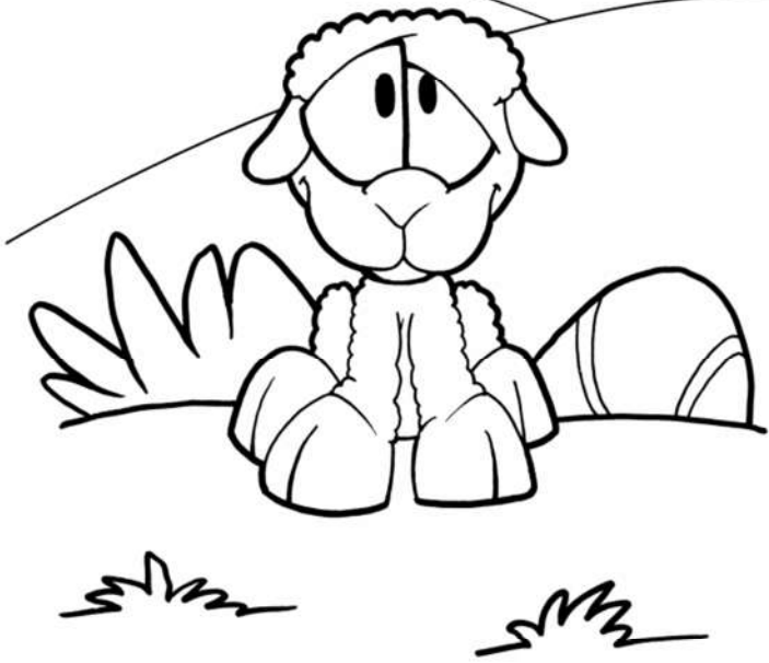
„Hľa, Boží Baránok, ktorý sníma hriech sveta“

nepoznal vodou Ducha prichádza zostupovať svedectvo Baránok neba videl známym Boží holubica Svätým krstíť svedectvo