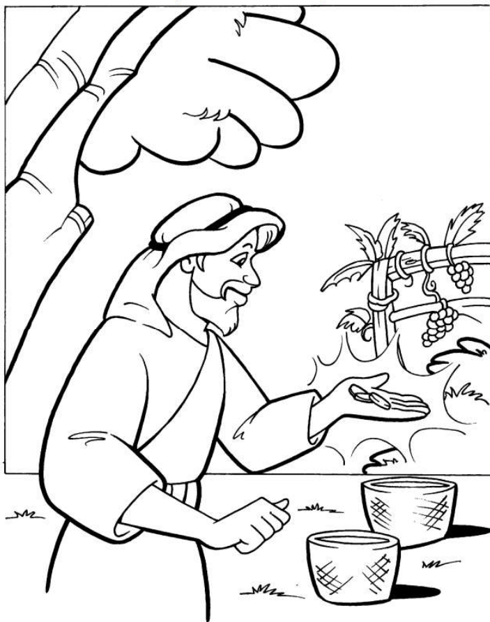
s povolením autora pre Bulletin. V prípade záujmu o pravidelný odber píšete na: bulletin.neetele@gmail.com