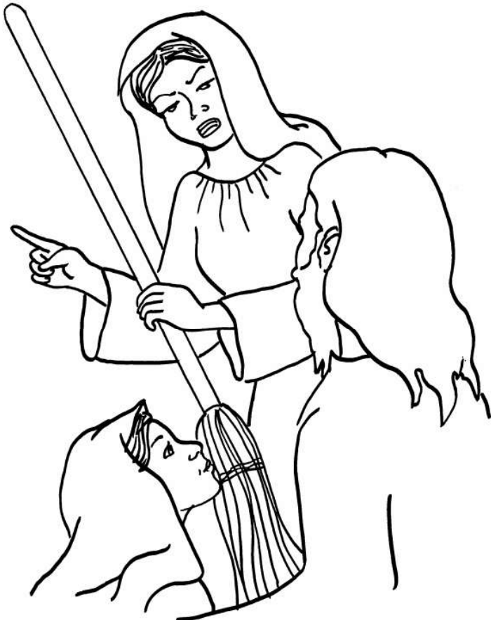
s povolením autora pre Bulletin. V prípade záujmu o pravidelný odber píšete na: bulletin.nedele@gmail.com