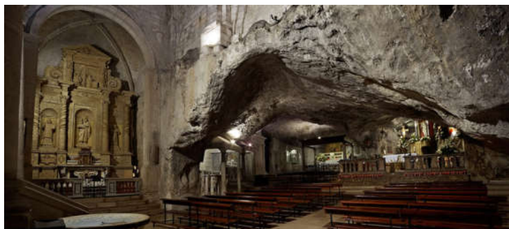
Jaskyňa zasvätená sv. Michalovi Archanjelovi