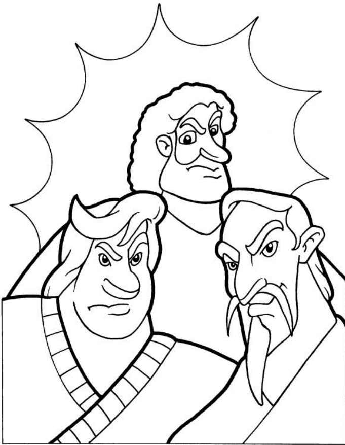
s povolením autora pre Bulletin. V prípade záujmu o pravidelný odber píšete na: bulletin.nedele@gmail.com

vinicu podobne vyvliekli zahubí vežu zabili plotom zabime syna uholným ukameňovali úrody úctu dedič oberačky