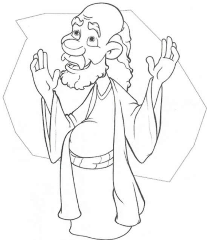
Ježiš uzdravuje desať malomocných Lk 17,11-19