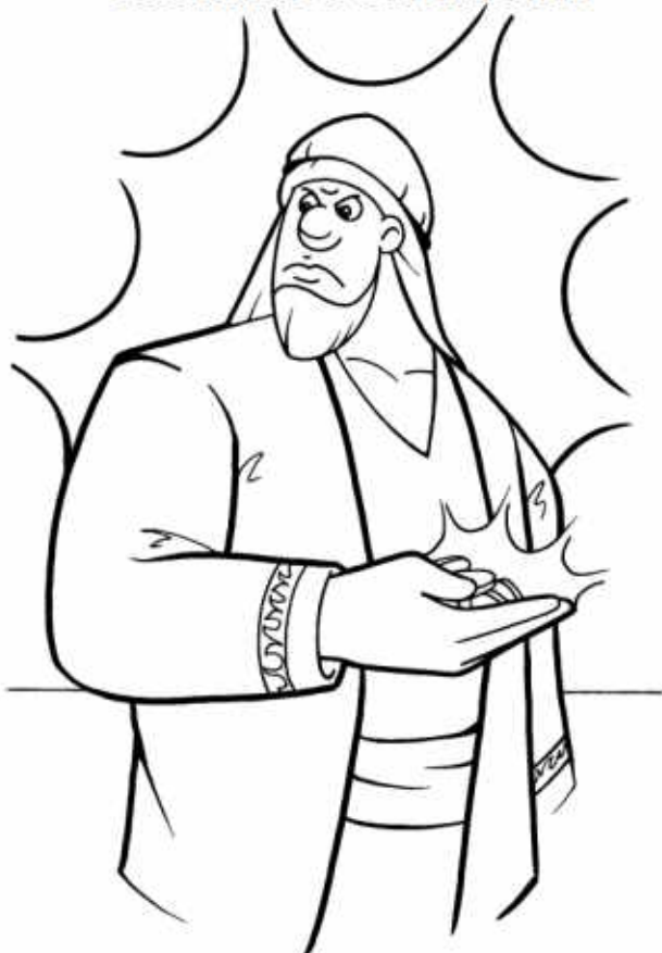
s povolením autora pre Bulletin. V prípade záujmu o pravidelný odber pište na: bulletin.nedele@gmail.com

verný päť majetok radosti jeden dva cestu dobrý málo odcestoval účtovať získal talentov mnohým zveril