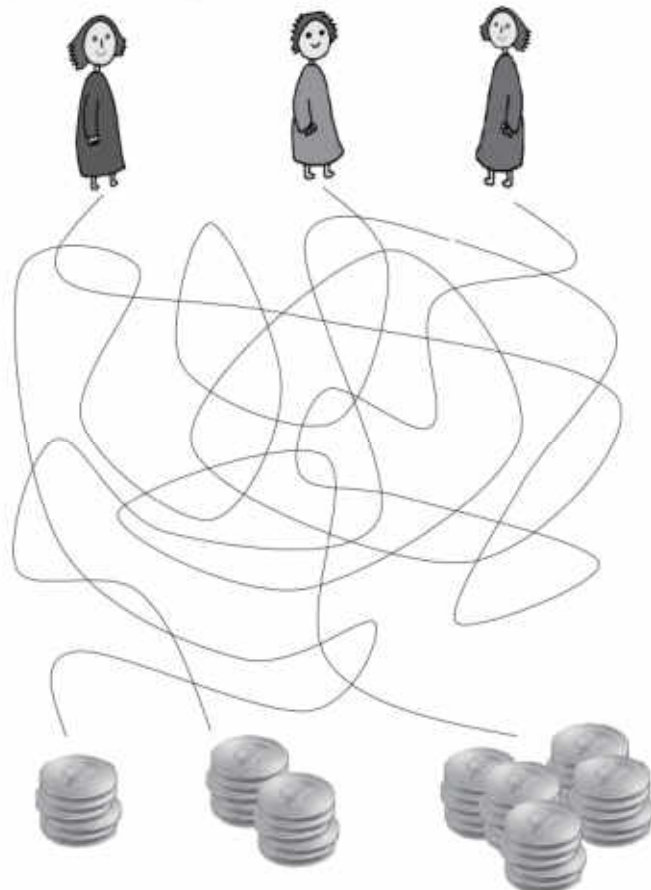
Riešenie z minulého čísla „kto chová rybičky“: rybičky chová Nemec.

Pán rozdelil sluhom peniaze. Prídeš na to, ktorý z nich dostal päť talentov, ktorý dva a ktorý jeden?