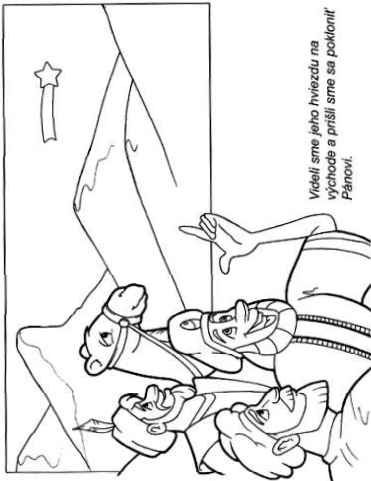
Videli sme jeho hviezdú na východe a prišli sme sa pokloniť Pánovi.