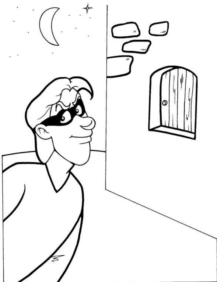
AKO ZLODEJ V NOCI

neviete jedli prípravení potopa neviete hospodár príchode zlodej vzatá ponechá mlyne vníknúť vydávali hodinu dva