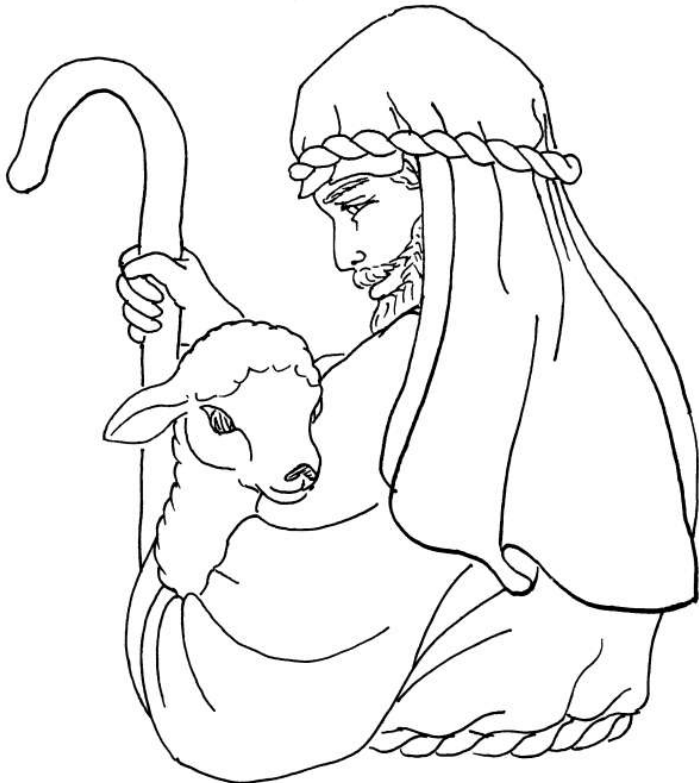
s povolením autora pre Bulletin. V prípade záujmu o pravidelný odber píšete na: bulletin.nedele@gmail.com