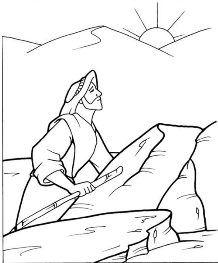
s povolením autora pre Bulletin. V prípade záujmu o pravidelný odber píše na: bulletin.nedele@gmail.com