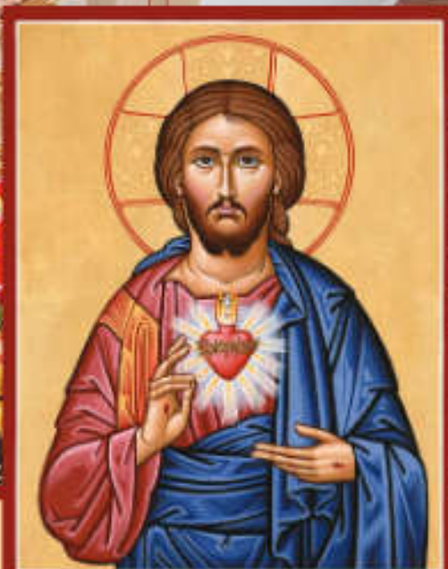
Ikona Ježiša Krista milujúceho ľudí (Christa Čelovikofubca)